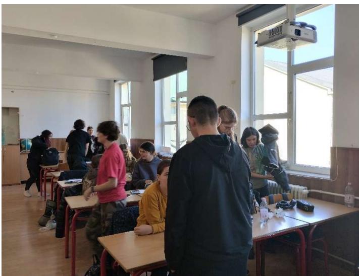
Testarea Rețetei de Mine la Liceul de Artă „Romulus Ladea” din Cluj-Napoca

5 adolescenți ucraineni și 9 adolescenți români au răspuns propunerii ca proiect comun, lucrând împreună și împărtășind rezultatele.